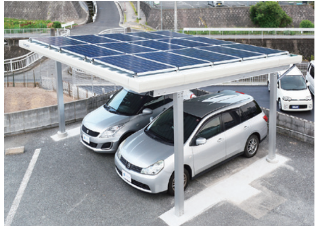
太陽光発電システム搭載カーポート「SUNSMART」。2台駐車用と3台駐車用を揃えており、連結することも可能だ

簡単だ。積雪についても、標準仕様品であれば80cm、多積雪仕様品だと150cmまで対応している。