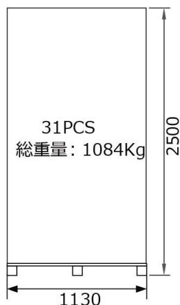
パレット単体：31枚 下段パレット正面図