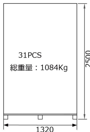
パレット単体：31枚 下段パレット側面図