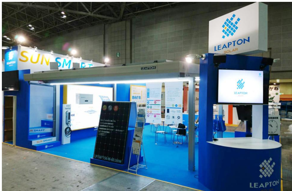
『第8回 太陽光発電システム施工展』 当社ブース

さて、2017年3月1日～3日に開催されました『第8回 太陽光発電システム施工展』では、ご多忙の折にもかかわらず、弊社ブースにお立ち寄りいただき、誠にありがとうございました。皆様のおかげをもちまして、盛況のうちに展示会を執り行うことができましたことを、心より御礼申し上げます。