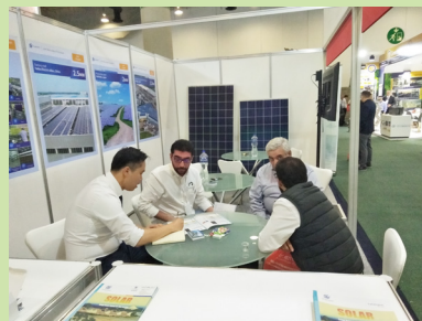
Renewable Energy India Expo (インド)