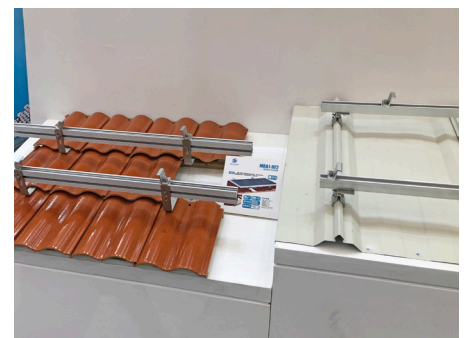
左：屋根架台 右：ハゼ折版用屋根架台

リープтонエネルギーでは、9月に大阪、10月にオーストラリア、ウクライナの展示会出展を予定しており、日本のみならず海外への販路開拓を積極的に進めてまいります。