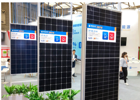
太陽電池モジュール各種